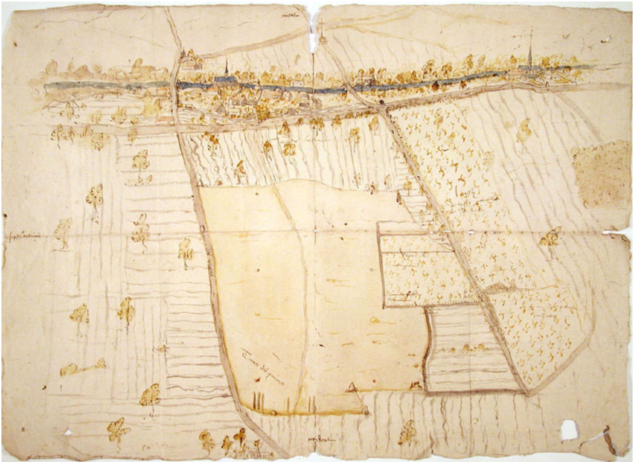
Vue de Saint-Aubin et du Paraclet, 1548 - Photo Archives de l'Aube [AD 10 - E* 2809]

Cette reconstitution est imparfaite et je compte sur la coopération de mes lecteurs pour m'aider à la compléter, à corriger ses erreurs.